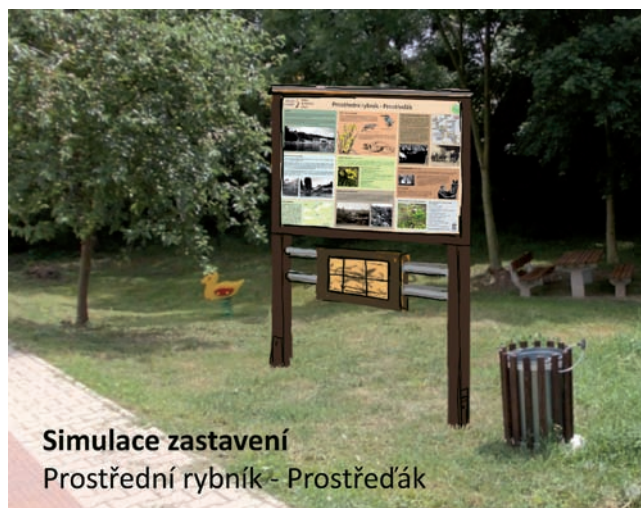
Simulace zastavení Prostřední rybník - Prostředčák

Výroba panelů i s tiskem byla svěřena do rukou vybraných odborníků a pro nás tím nastalo jen příjemné očekávání hotového díla.