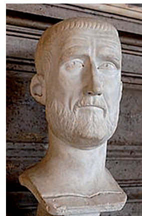
Marcus Aurelius Probus – římský císař vládnoucí v letech 276-282 n. l.